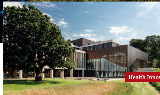
Health Innovation Campus